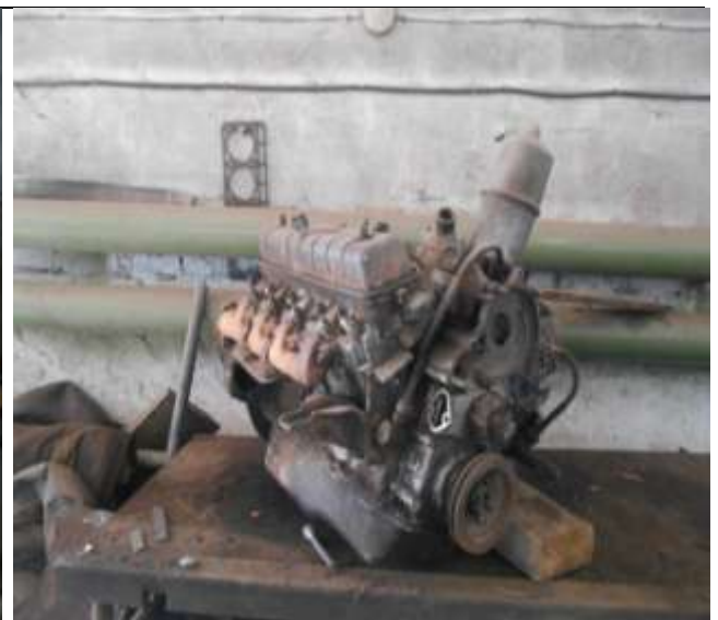
9. Ремонтная мастерская