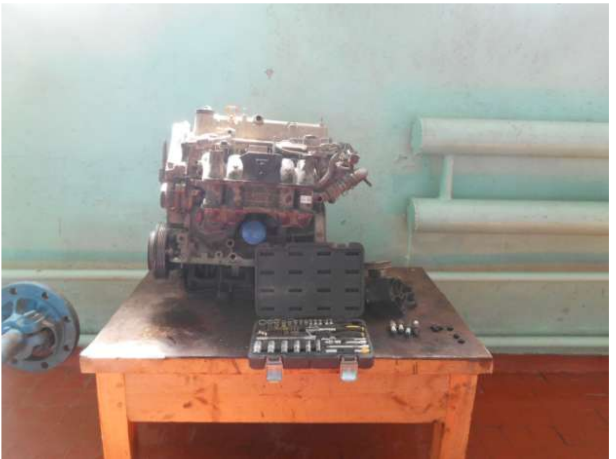
8. Лаборатория двигателей внутреннего сгорания