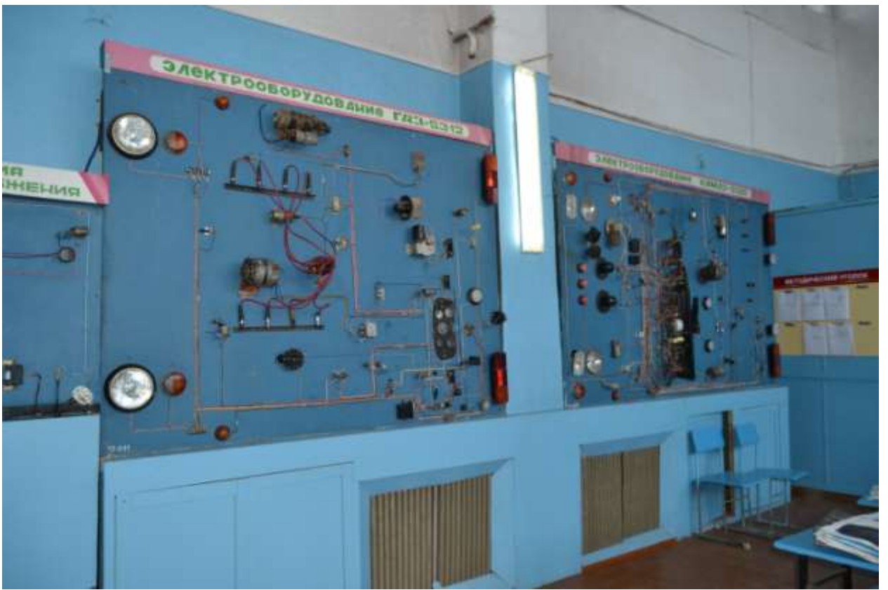
7. Лаборатория технического обслуживания автомобилей